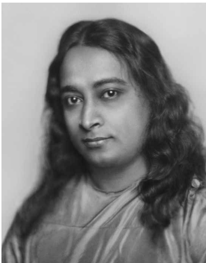
ปรมหังสา โยคานันตะ (ค.ศ. 1893 – 1952)