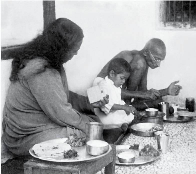
ท่านปรมทั้งสา โยคานันทะ กับ ท่านมหาตมา คานธี วราธา, อินเดีย, ค.ศ. 1935

มีส่วนร่วมกับการสวดอธิษฐานของสมาชิกทั่วโลกของเซลฟ์ รีอะไลเซชัน เฟลโลว์ชิพ โปรดดูไบสมัคร้ายหนังสือเล่มนี้